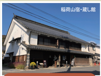
稲荷山重要伝統的建造物群保存地区